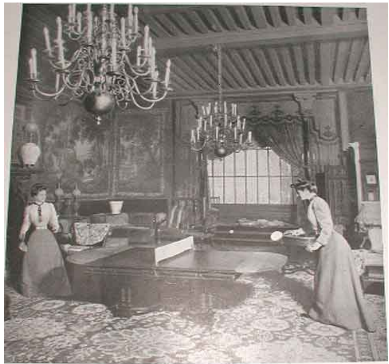
Ping-Pong in England